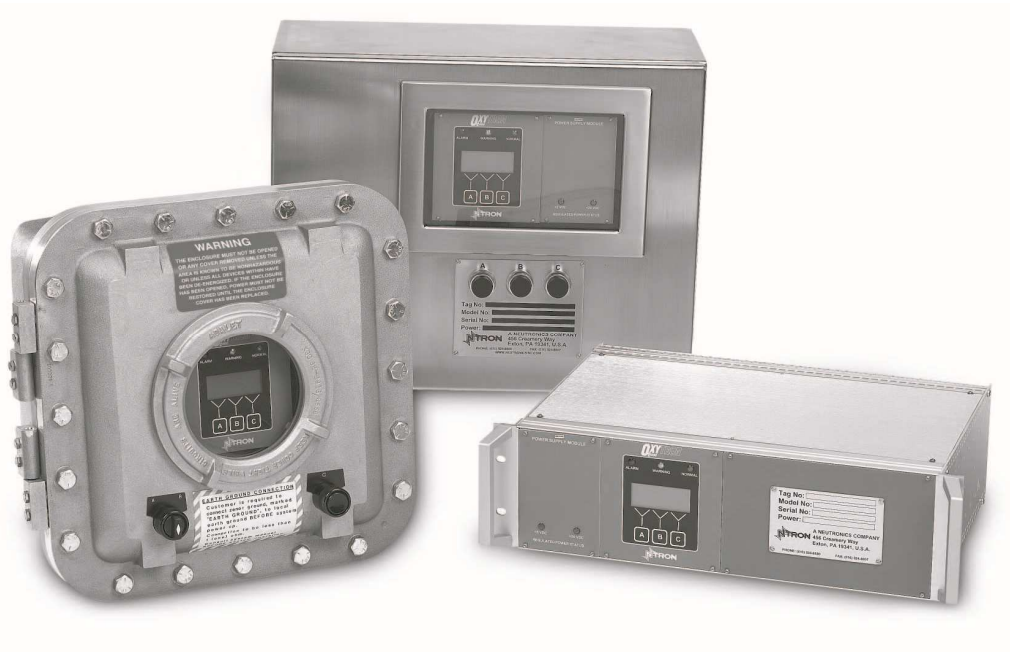
イナートガスコントロールシステム用 Oxytron2000 酸素分析計シリーズ